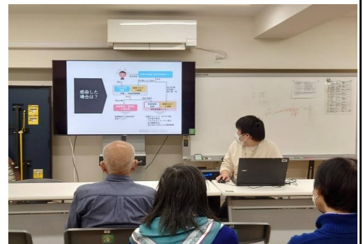
勉強会の実施風景