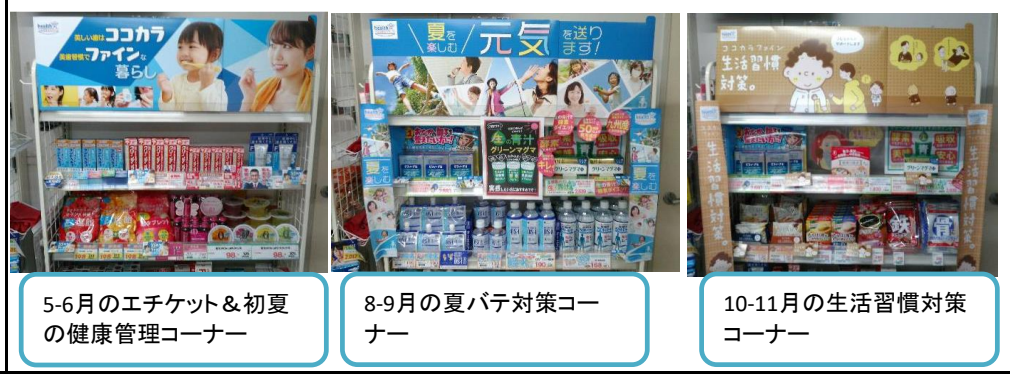
5-6月のエチケット&初夏の健康管理コーナー