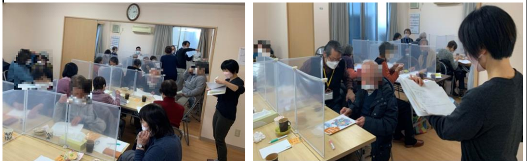
勉強会の実施風景