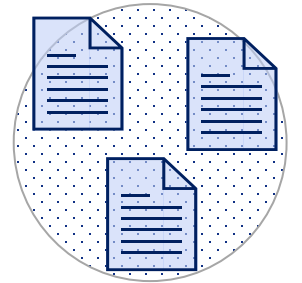
調剤結果情報 (紙の処方箋に対する調剤結果)