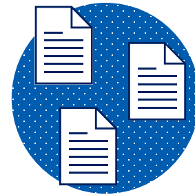
調剤済み電子処方箋