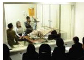
模擬居室での在宅医療研修