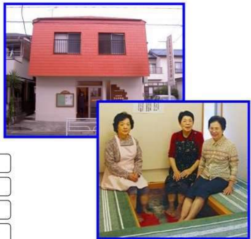
(出典)地域包括ケアシステム構築に関する取組事例(小田原市)