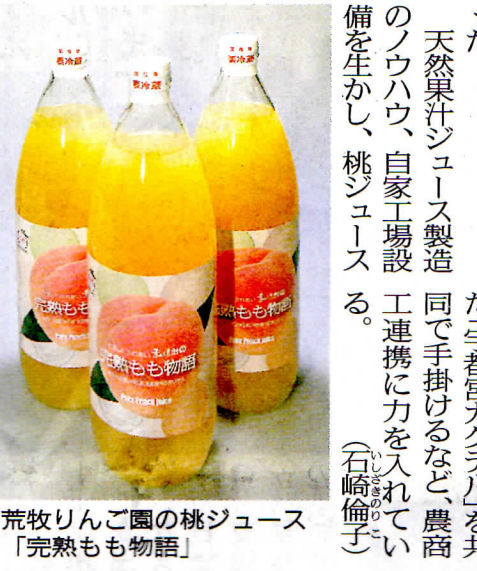
荒牧りんご園の桃ジュース「完熟もも物語」

加工技術生かし新発売 天然果汁ジュース製造のノウハウ、自家工場設 工連携に力を入れてい 備を生かし、桃ジュース (石崎倫子 が本格化する前の7月末の開発に挑戦。荒牧代表から8月中旬に、もう一 は「桃の味を引き出す つの収入の柱をつくっ ための種抜き作業が大 た」という。ここ数年、 変だった。完璧な味わい 9、10月の厳しい残暑で に仕上がった」と話して いる。 同園は県のフードパレ ース用に加工し、収入安 ーとちぎ推進協議会に参 定化、高付加価値化を図 加。県産フルーツを使っ